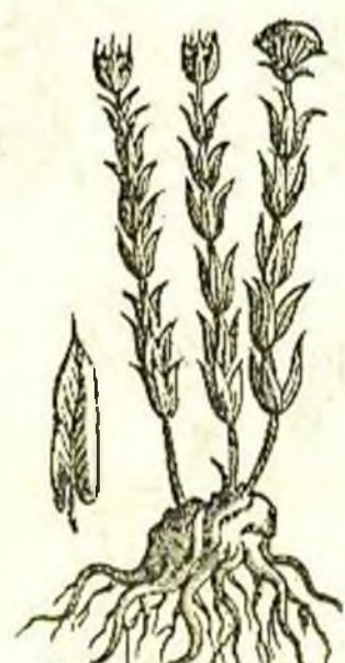
COAPATL DE TEPICAHUATL