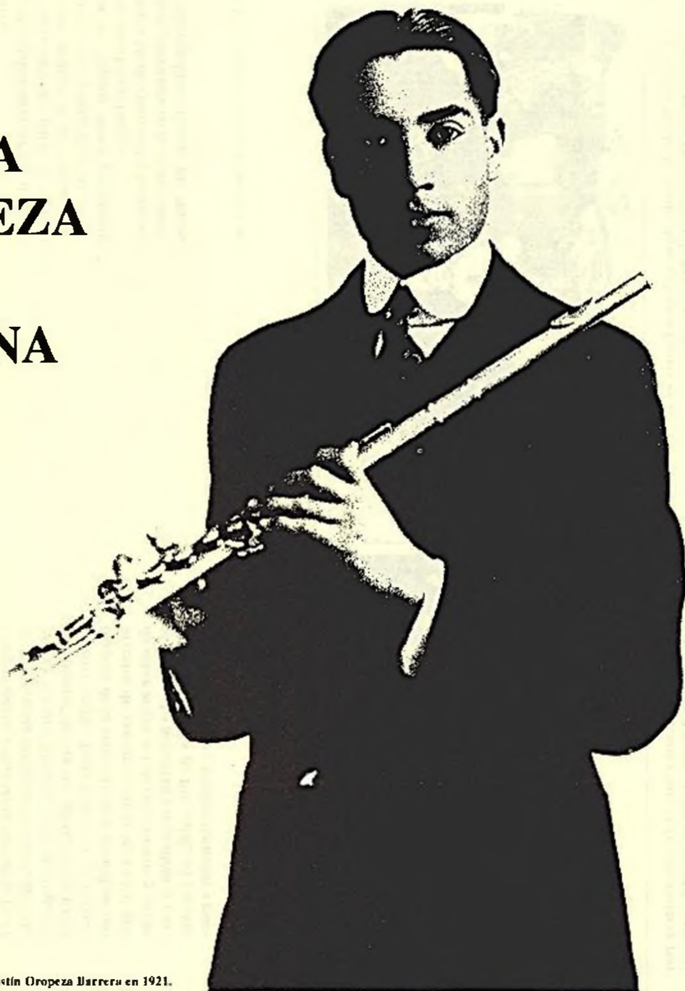
El gran flautista Mexicano Agustín Oropeza Barrera en 1921.

A sus 102 años de edad Agustín Oropeza Barrera es probablemente el músico más longevo de México. Durante cuatro décadas: de 1920 a 1960, se le consideró el más grande flautista nacional y uno de los mejores acompañantes de cadencias. Por muchos años las divas de la ópera se hicieron acompañar imprescindiblemente por él, la propia María Callas fue acompañada por Agustín Oropeza, cuando cantó por primera vez en México en 1952.