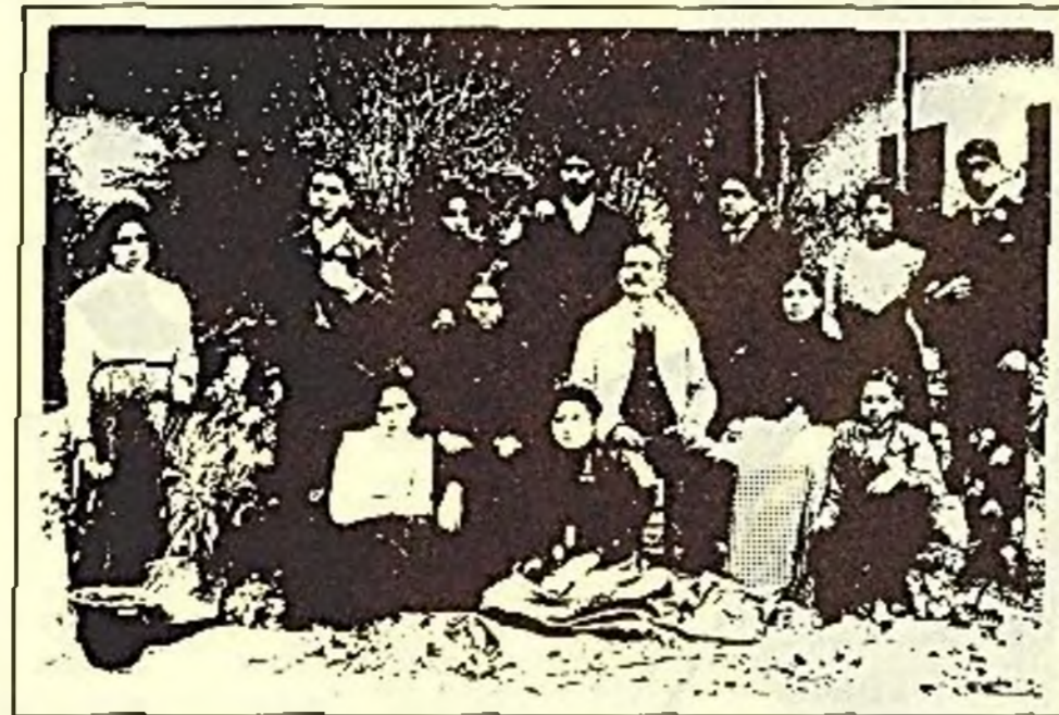
Foto de la familia del maestro Agustín Oropeza Herrera en su casa de Zacatlán, Puebla en 1902 (a la derecha sentado)