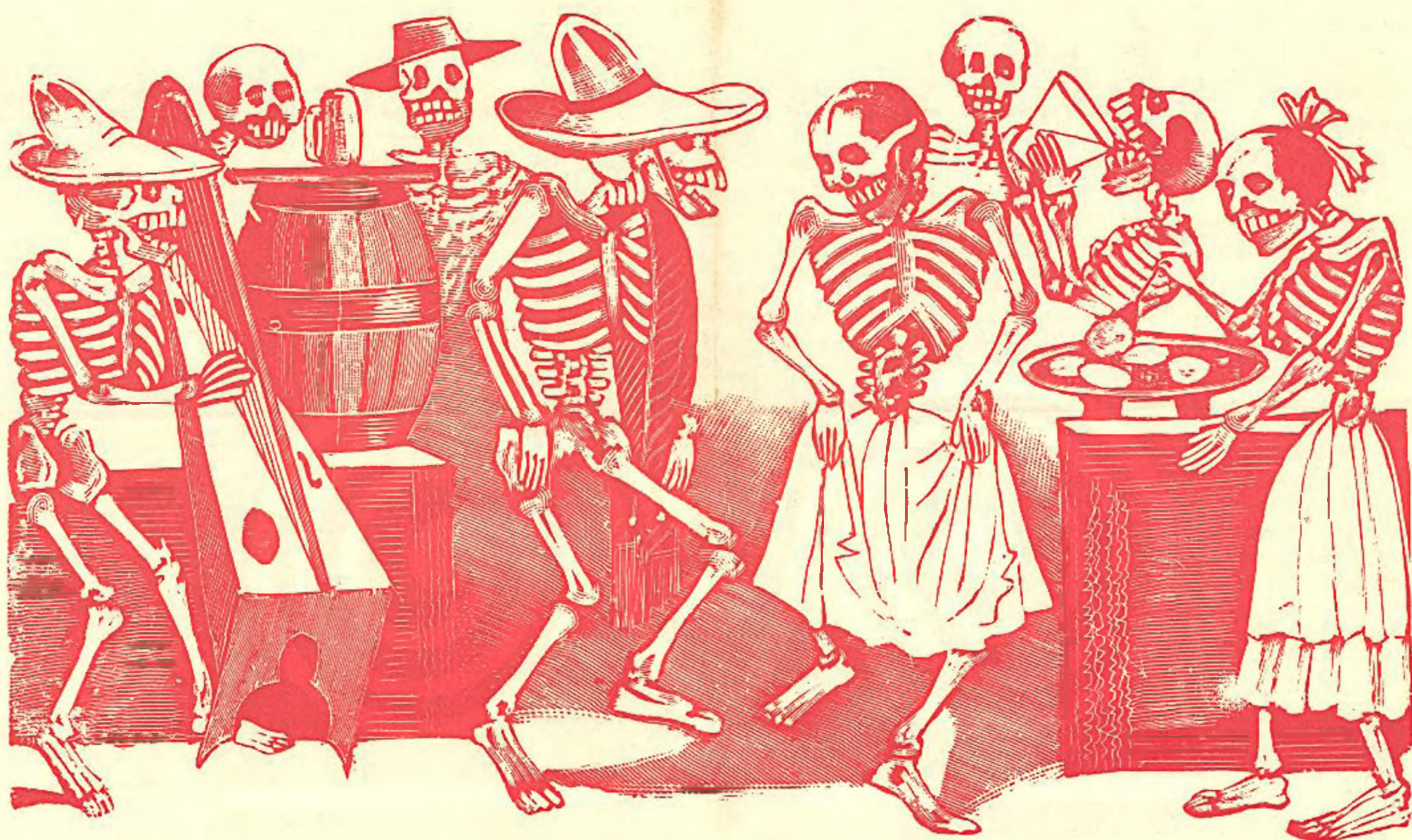
Gran fandango y francachela de todas las calaveras, grabado de José Guadalupe Posada

México-Querétaro, Año I. Segunda Epoca, No. 11 Septiembre de 1988