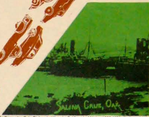
G. Casasola, Seta Siglos de Historia Gráfica de México 1325-1976, T. 5, p. 1442.