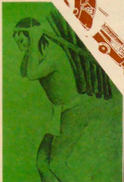
El transporte en México, f.p. L. J.

En el año de 1916, surgieron los primeros camiones para transportar pasajeros. Con el transcurso del tiempo fueron aumentando sus líneas a distintos rumbos de la ciudad.