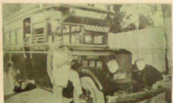
El transporte en México, f.p. L. J.

En el año de 1916, surgieron los primeros camiones para transportar pasajeros. Con el transcurso del tiempo fueron aumentando sus líneas a distintos rumbos de la ciudad.